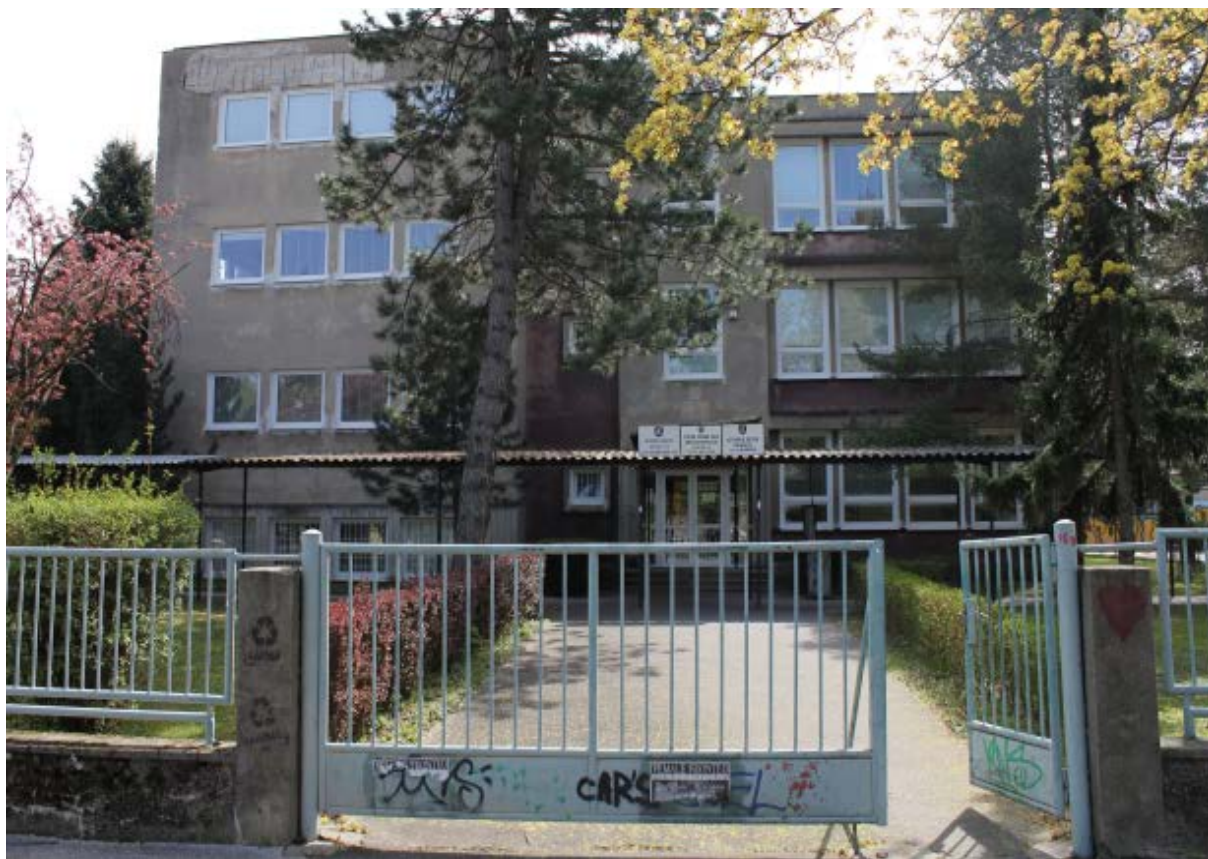
budova súpisné číslo 95 – školský pavilón „D“