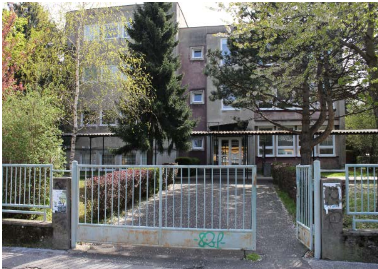
budova súpisné číslo 96 – školský pavilón „C“