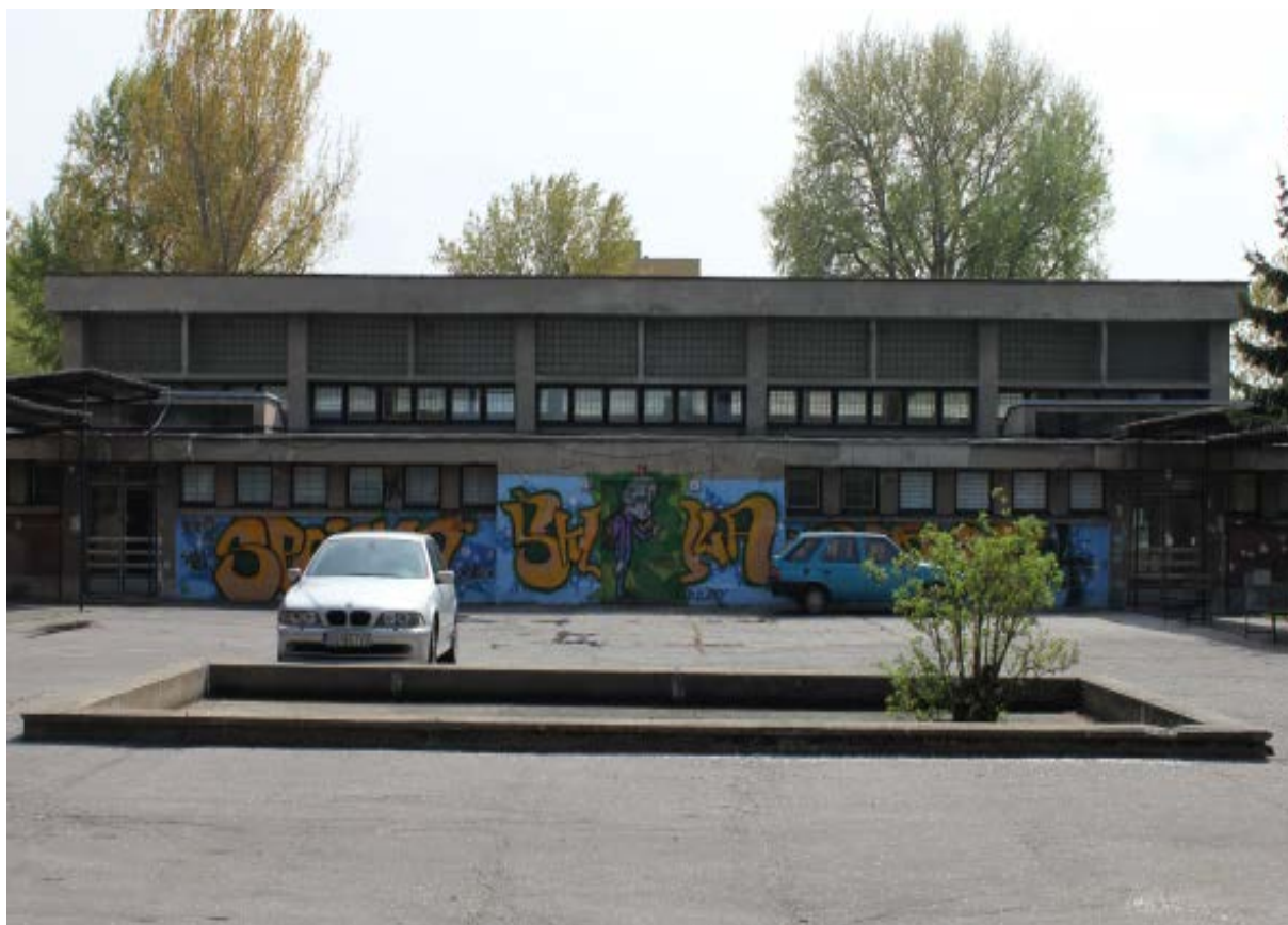
budovy dielní na Galvaniho 2/A